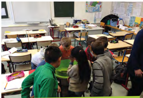
Animation en classe sur le lombricompostage