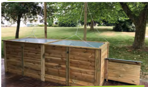
Le compostage des déchets de cantine scolaire