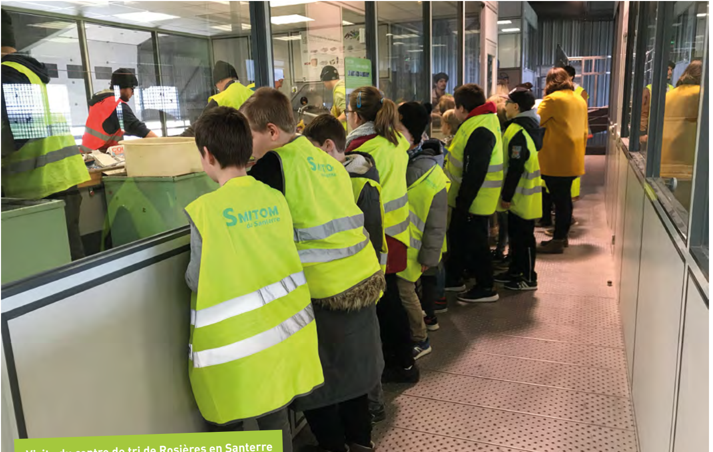
Visite du centre de tri de Rosières en Santerre

EN CHARGE DU TRI ET DU RECYCLAGE SUR LE TERRITOIRE, LE SMITOM DOIT SENSIBILISER LE PUBLIC ET LES SCOLAIRES AUX QUESTIONS LIÉES À L'ENVIRONNEMENT AU SENS LARGE.