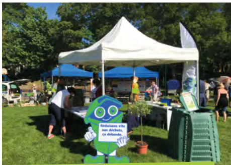
3 e participation au marché aux plantes de Montdidier