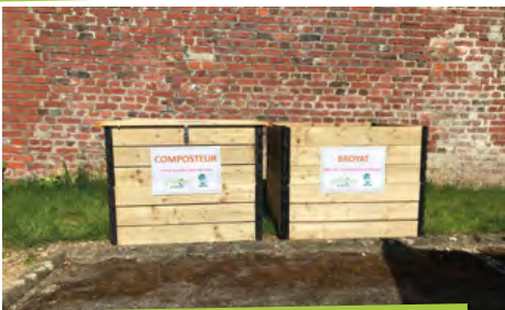
Le compostage collectif, ÇA MARCHE !