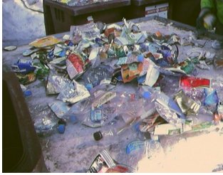
Caractérisation de la CCP neslois le 25/02/2003